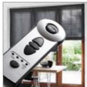
Sznur dostępny w 5 kolorach: białym, beżowym, szarym, brązowym i czarnym. Sterowanie elektryczne 24 V