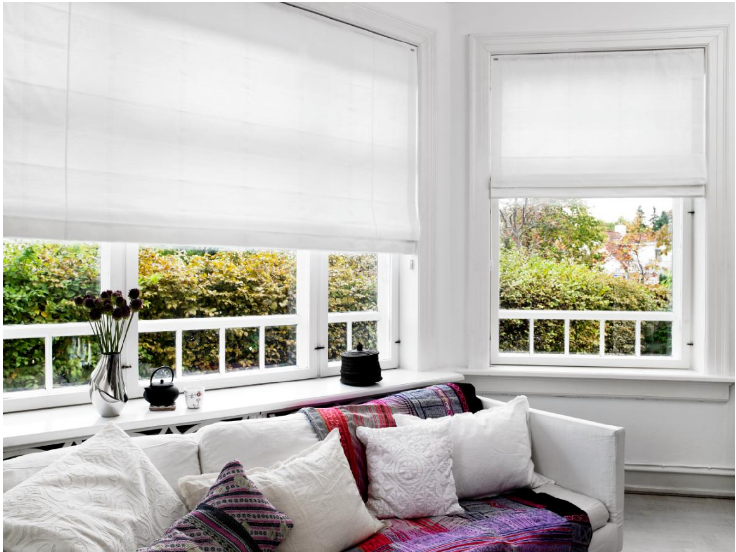
8231 Fennia Bialy