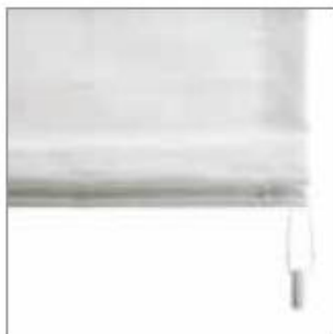
Łańcuszek plastikowy dostępny w 5 kolorach: białym, beżowym, szarym, brązowym i czarnym