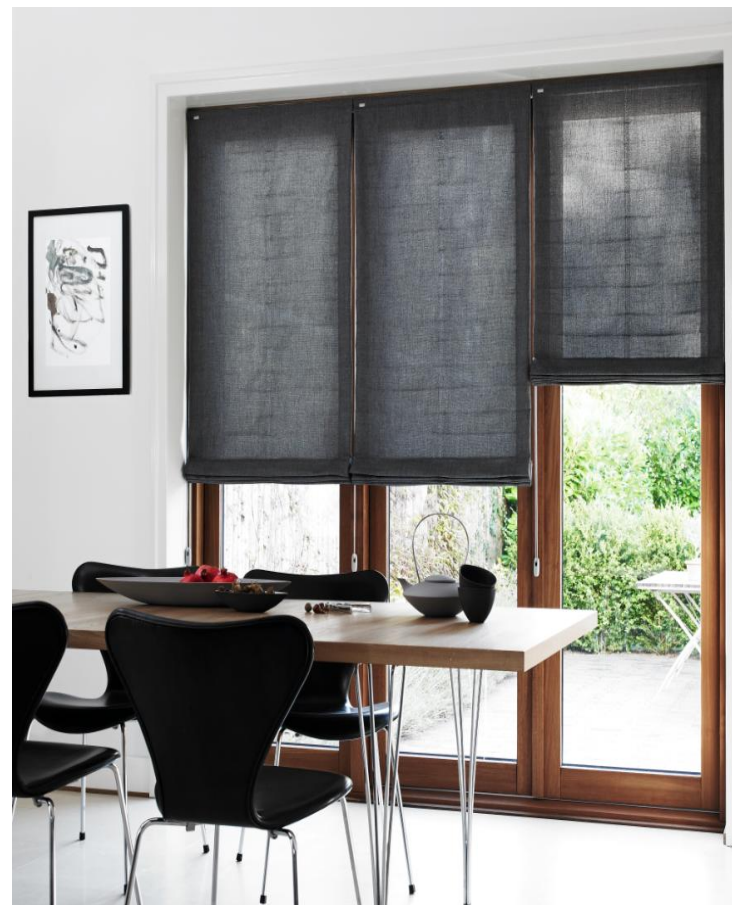
8748 Himalia Szary